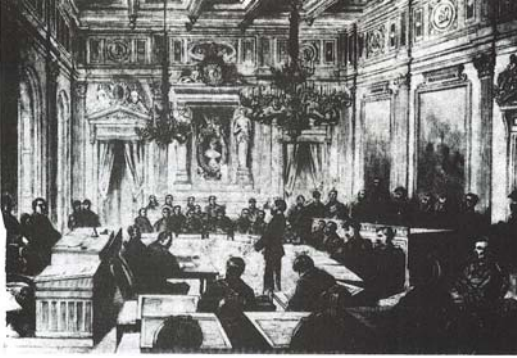
جلسه کمون پاریس در تالار شهرداری

دهها هزار سرباز اسیر فرانسوی را بمنظور کمک به تییر از زندان آزاد کرد. تییراسیران کمون را بدون محاکمه تییرباران می نمود. کمون ناچار شد برای حمایت از جان اسیران خود و در مقابل عمل غیر انسانی کشتن کموناردهای اسیر، از هواداران ورسای گروگان بگیرد.