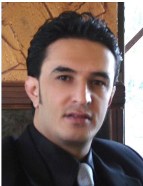
كاروان نە جەمەدىن

ئىمە بانگەوازانى شۆرشىن ، زەمانىكە بانگەوازي شۆرش ئەكەين ، ئەمرو شۆرش شكلى گرتەو و ئەمرو ئەو شۆرشە بانگەوازان ئەكات ، بانگەواز ئەكات كە پىخراوى بىكەين ، يەكگرتوى بىكەين ، پابەرايەتى بىكەين و بە سەركەوتنى بگەينەين ، ئەم كۆنگرەيە تەواوى ھەدەف و ئەركو كارى كە ئەبىيەت لەم دوو پوژەدا ئەنجامە بدات ئەو يەكە وەلامى ئەم بانگەوازي خەلك بداتەو ، خەلك بانگەوازي ئىمە ئەكەن بۇئەو ھى شىعارەكانيان پوژىن بگەينەو ، پىخراۋايانەكەين ، پابەرايەتتە بىكەين و سەريانەكەين ، ئەم كۆنگرەيە ئەبىيەت وەلامى ئەم بانگەوازي بداتەو و من گومانم نىە كە ئىمە بە سەركەوتوانە كۆتايى بە كۆنگرە بىنەين و وەلامى راست و دروست بەم بانگەوازي كۆمەلگە ئەدەينەو .